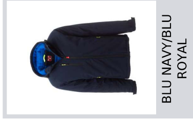
BLU NAVY/BLU ROYAL