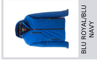
BLU ROYAL/BLU NAVY

Composizione: 95% POLIESTERE + 5% ELASTAN