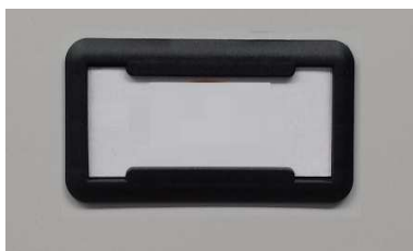
Porta cartellino in materiale plastico