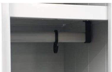
Appenderia interna in PVC