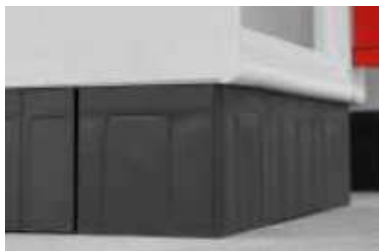
Zoccolo in polipropilene PP